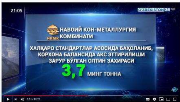
Навоий кон-металлургия комбинати замонавий компанияга айлантирилади