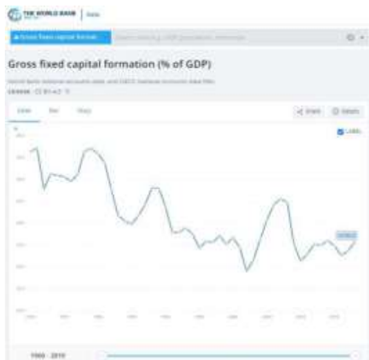
9-gasm. АКЯЖнинг ЯИМга нисбатан даражаси

Жоҳон банкининг (мамлакатларнинг) миллий ҳисоботлари асосидаги маълумотларига (рус. Данные по национальным счетам Всемирного банка) кўра бутун дунё бўйича 2019 йилда ишлаб чиқарилган Ялпи ички маҳсулотнинг (ЯИМнинг) қиймати 87 752 млрд. (Саксон етти триллион 752 миллиард) АҚШ долларига тенг бўлган.