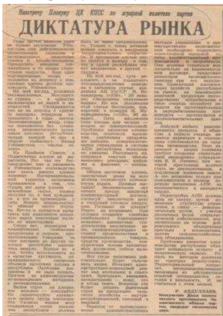
1-rasm. "Диктатура рынка", "ПВ" №50, 28.02.1989 г.